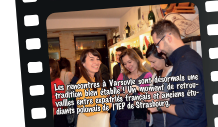
Les rencontres à Varsovie sont désormais une tradition bien établie ! Un moment de retrouvailles entre expatriés français et anciens étudiants polonais de l'IEP de Strasbourg.