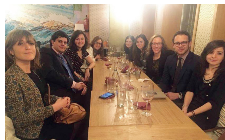
Ce premier événement s'est tenu dans la joie et la bonne humeur, première rencontre qui ne devrait pas être la dernière !

Rappelons que les universités Autonoma et Complutense de Madrid ont noué des partenariats de longue date avec l'IEP de Strasbourg. En outre, plus de 40 000 Français sont inscrits au registre du Consulat de France à Madrid, ce qui souligne l'importance de la communauté française dans cette ville.