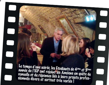
Le temps d'une soirée, les Etudiants de 4 ème et 5 ème année de IEP ont rejoint les Anciens en quête de conseils et de réponses liés à leurs projets professionnels divers et surtout très variés !