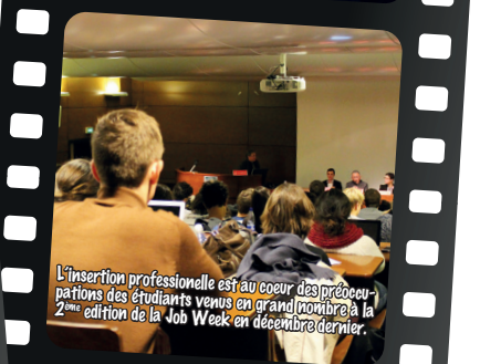
L'insertion professionnelle est au cœur des préoccupations des étudiants venus en grand nombre à la 2 ème édition de la Job Week en décembre dernier.