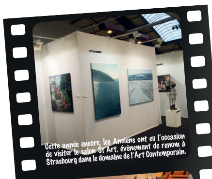
Cette année encore, les Anciens ont eu l'occasion de visiter le salon St Art, événement de renom à Strasbourg dans le domaine de l'Art Contemporain.